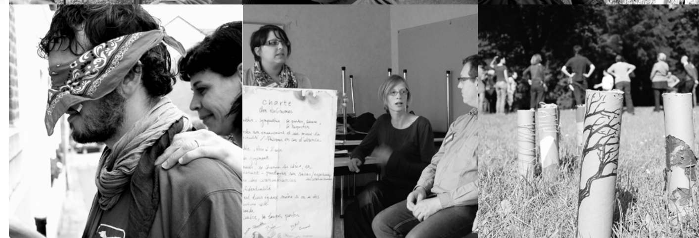
Des ateliers pour découvrir et parfois même expérimenter ce qui se fait « ailleurs », pour échanger autour des pratiques pédagogiques, pour alimenter la réflexion et susciter la collaboration entre secteurs.