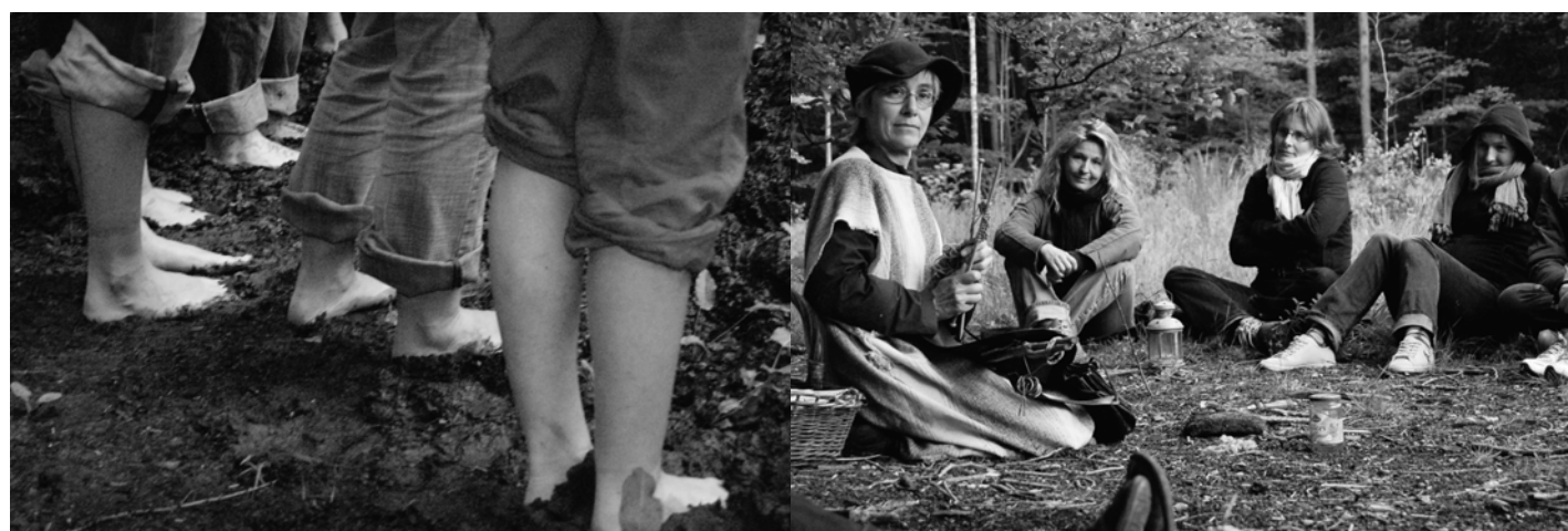
Balade pieds nus (CRIE d'Harchies), des contes dans les bois (CRIE de Spa)... et d'autres activités découverte le premier soir.

« Le monde est un village », un premier pas pour découvrir les réalités institutionnelles des autres secteurs et se découvrir entre acteurs de terrain.